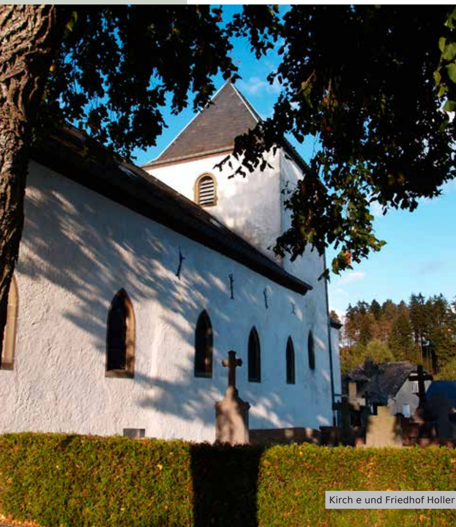
Kirche und Friedhof Holler

Im Jahr 1778 wird aus hygienischen Überlegungen die Bestattung innerhalb von Kirchenräumen, Kapellen und Klöstern verboten. Wenig später untersagte ein weiteres Dekret die Betreibung von Friedhöfen im Innern der Städte. Die Verstorbenen wurden aus der Mitte der Lebenden an den Ortsrand verdrängt. Diese Entscheidung ging einher mit städtischen Sanierungsmaßnahmen, der Schaffung neuer öffentlicher Plätze und der Einführung einer Stadtbeleuchtung.