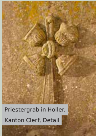
Priestergrab in Holler, Kanton Clerf, Detail