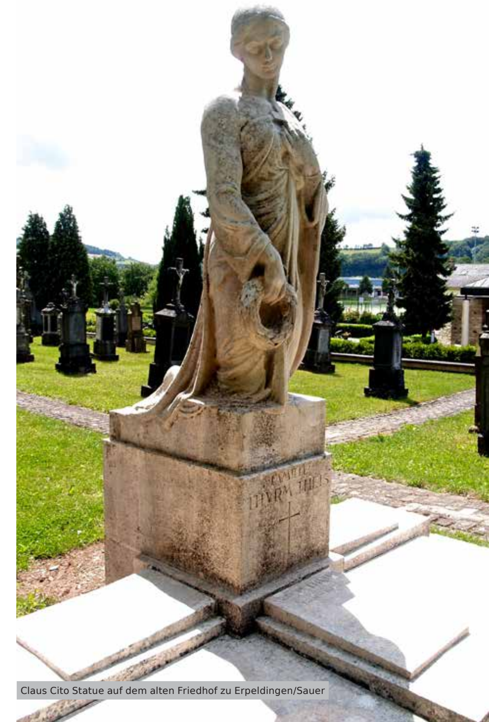
Claus Cito Statue auf dem alten Friedhof zu Erpeldingen/Sauer