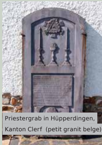
Priestergrab in Hüpperdingen, Kanton Clerf (petit granit belge)