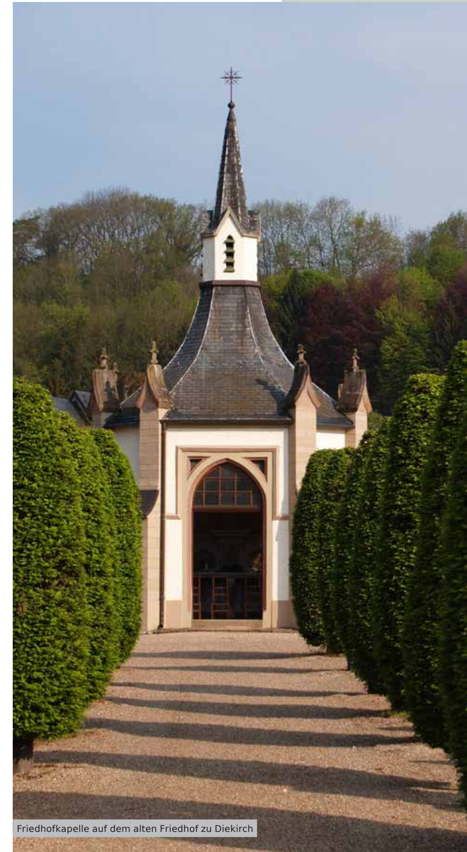
Friedhofkapelle auf dem alten Friedhof zu Diekirch

Grabdenkmäler dienen der Erinnerung, und unterscheiden sich von sonstigen Denkmälern durch die Anwesenheit der sterblichen Überreste oder der Asche. Hat sich der heutige Grabeigentümer für den Erhalt des Denkmals entschieden, und will er das Denkmal restaurieren, kann es vorkommen, dass die Gebeine ins örtliche Beinhaus überführt werden. Die Stabilisierung des Denkmals verlangt einen tiefen Eingriff in das Fundament. Das Grabmal bleibt erhalten, wurde aber zum Denkmal umgestaltet, denn die geschätzte Person ist nun abwesend. Lobenswert sind die gemeindeeigenen Initiativen zum Erhalt historischer Grabdenkmäler, doch auch bei privaten Konzessionseigentümern gibt es hervorragende Beispiele gelungener Restaurierung. In der Wallonie gibt es die Möglichkeit historische Gräberdenkmäler, bei Ende einer Konzession, privat zu übernehmen und zu nutzen. Könnte das auch ein Ansatz für Luxemburg sein?