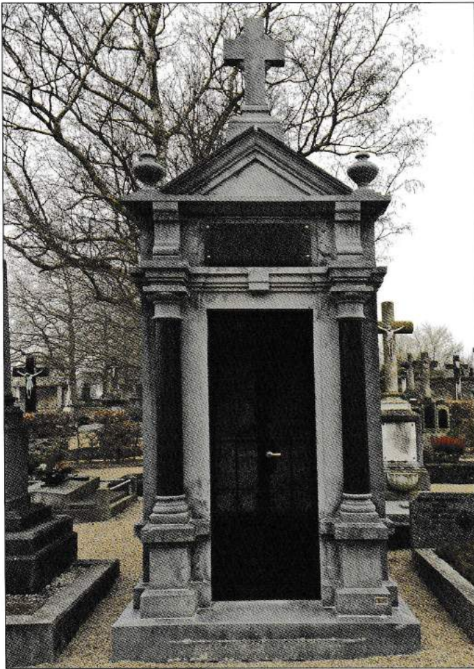
Auch Privateigentümer schützen auf eigene Initiative und Budget Grabmonumente ihrer Familie. (Chapelle privée)

Eindruck verlassener Gräber. Der Besitzer verfügt nicht mehr um die nötige Zeit, Mittel oder physische Kraft für den entsprechenden Unterhalt, und doch will er das Grab mit seinen ihm wertvollen Angehörigen erhalten, oder es gar selbst nutzen. Rechtens ist er verantwortlich für die Sicherheit des Denkmals. Niemand kann den Besitzer einer Konzession zu Unterhaltsarbeiten zwingen, welche nicht direkt mit Sicherheitsvorkehrungen zu tun haben: „L'administration communale peut inviter les concessionnaires à enlever dans un délai déterminé les monuments menaçant de tomber en ruines. Le Service des cimetières est en droit de démolir et d'enlever d'office les parties détériorées lorsque les concessionnaires ne donnent pas la suite voulue à l'avertissement qui leur a été notifié.“ besagt dazu dass städtische Gemeindefreigabe 7 .