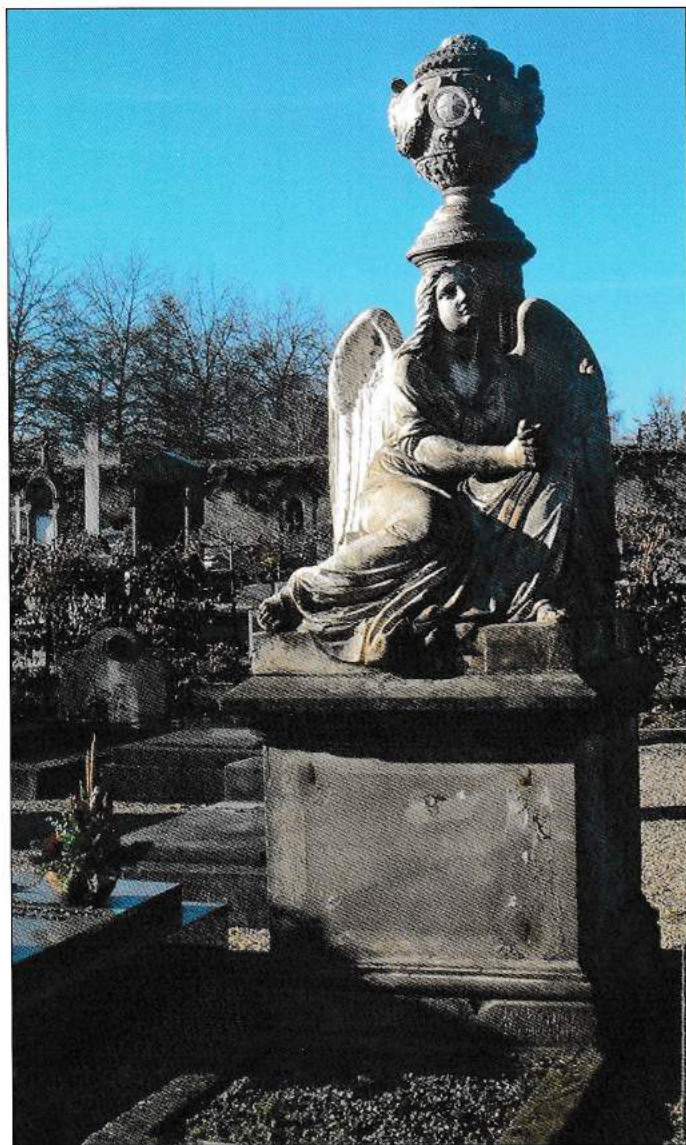
Auch industriell hergestellte Grabsteine werden von der Stadt Luxemburg geschützt. (Monument urne avec ange,)